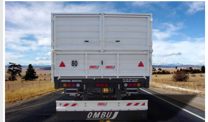
Puertas traseras tipo cerealeras.