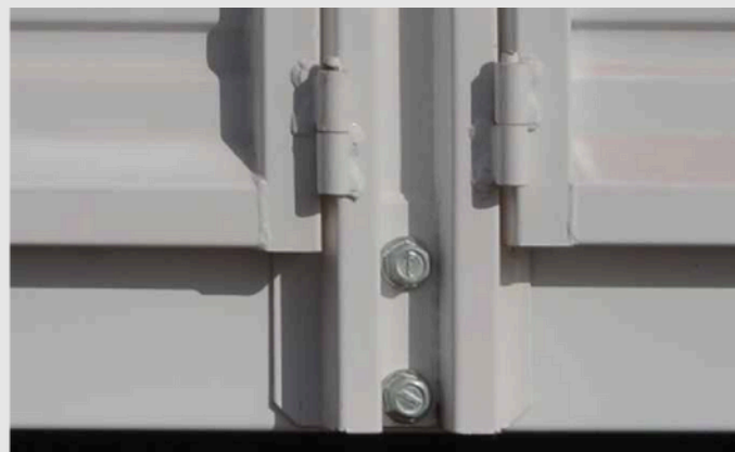
Parantes desmontables y ajustables con bulones de rosca de avance rápido.