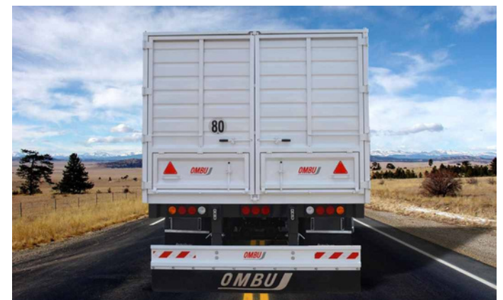
Puertas traseras tipo libro con troneras.

VERSATILIDAD Y RESISTENCIA. PARA UNA LOGÍSTICA ÁGIL Y SEGURA.