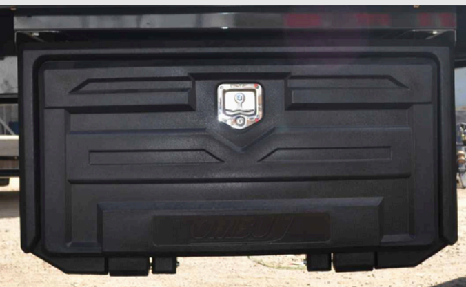
Cajón de herramientas plástico.